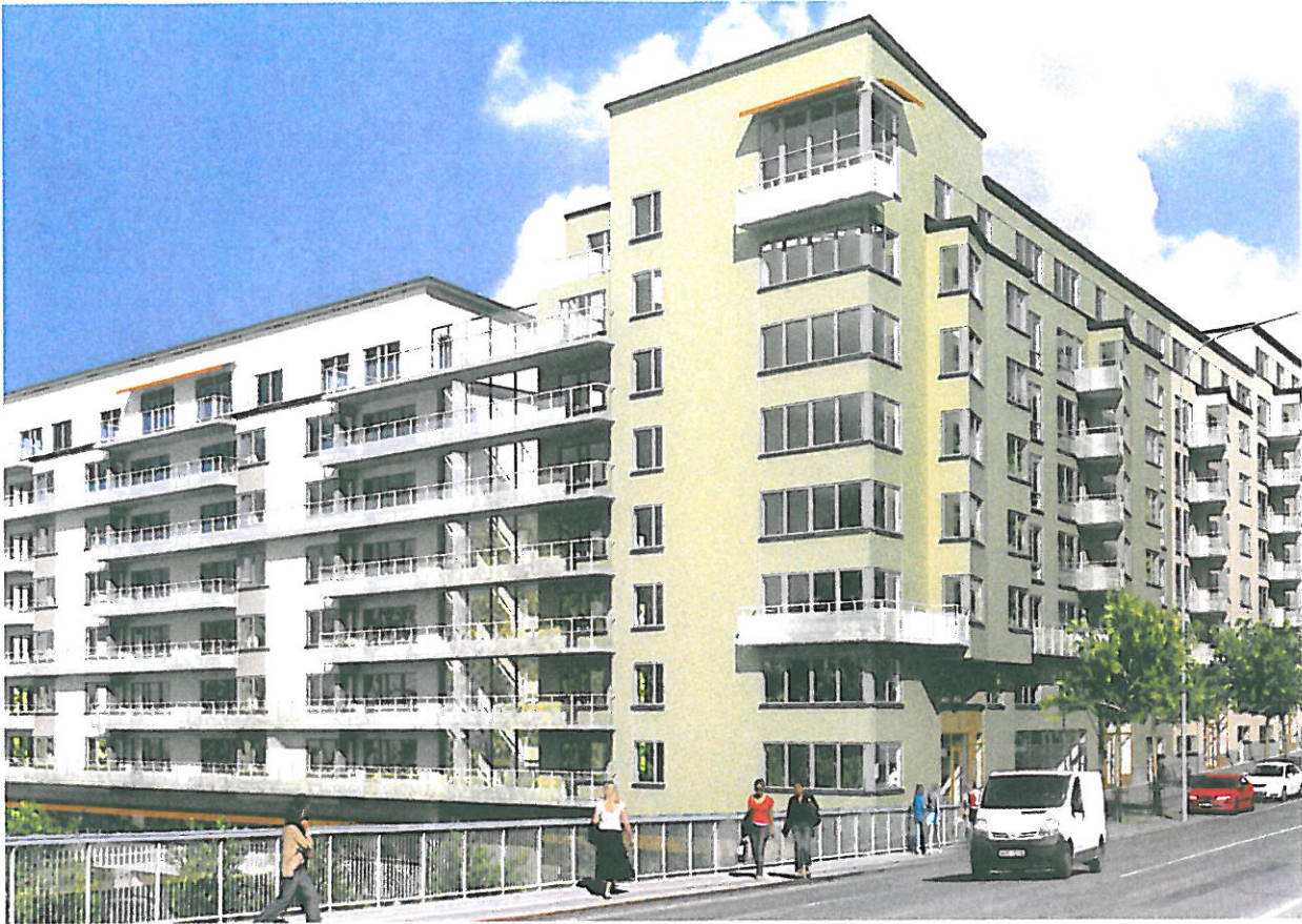
Bilden visar en illustration av det planerade kvarteret Snöflingan. Med reservation för eventuella ändringar.